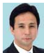
衆議院議員 遠山 清彦氏