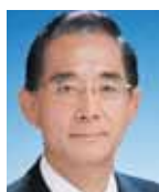
衆議院議員 原田 義昭氏