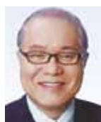
参議院議員 武見 敬三氏